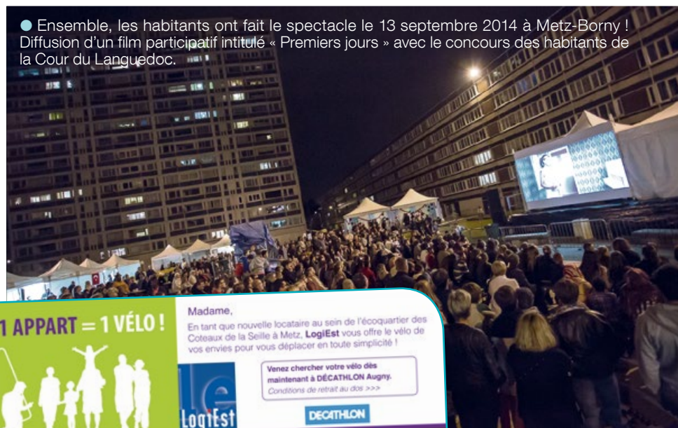
● Ensemble, les habitants ont fait le spectacle le 13 septembre 2014 à Metz-Borny ! Diffusion d'un film participatif intitulé « Premiers jours » avec le concours des habitants de la Cour du Languedoc.